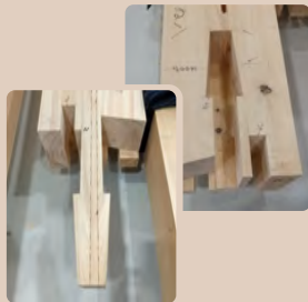
継手（つぎて）加工された木材