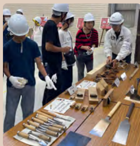
宮大工による道具解説