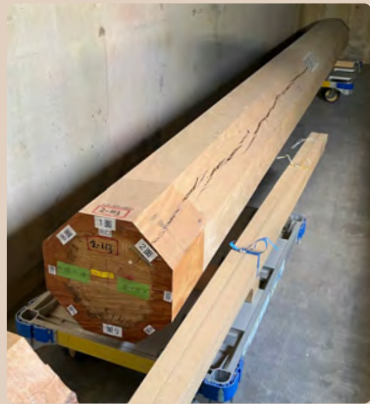
正殿の柱材の予備として保管していたイヌマキ等