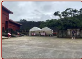
集合場所（このテントが目印）