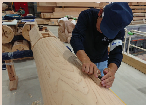
カンナ掛けの加工体験