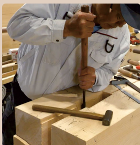
継手（つぎて）加工見学