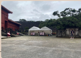
集合場所（このテントが目印）