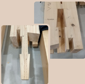
継手（つぎて）加工された木材