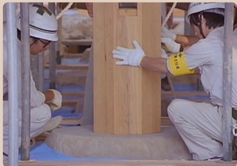
石場立て（平成復元時の写真）