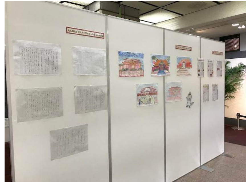
平成30年度に開催した、学習結果報告展の様子（首里城公園首里杜館ビジターロビー）