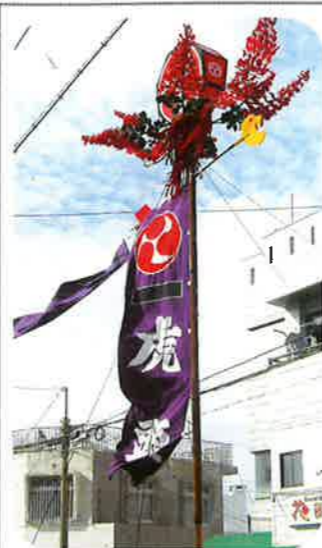
赤平町自治会(子ども会)