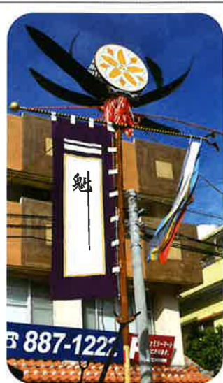
真和志町自治会(子ども会)