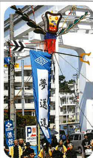
儀保町自治会(子ども会)