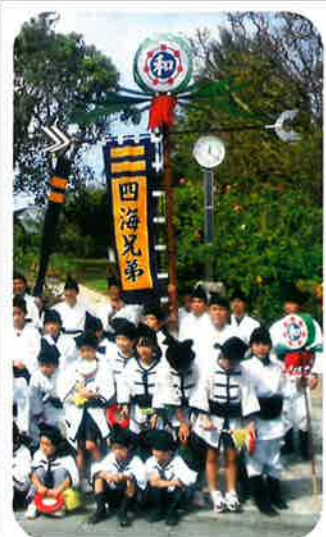
崎山ハイツ(子ども会)