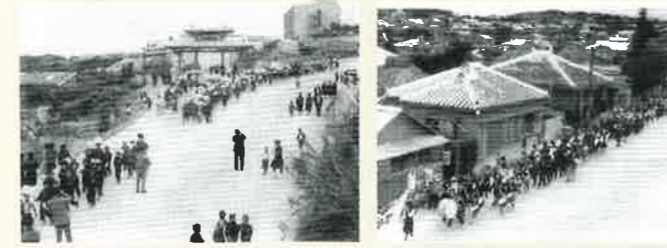
教育まつり 行列風景

そこで、旧「首里文化祭実行委員会」では、澎湃として興った首里地区の文化活動を総括的に発展させ、県内外のお力添えを大きく受け入れるためにも、体制を改める必要ありとして、「首里振興会」と、名実を整えた次第です。