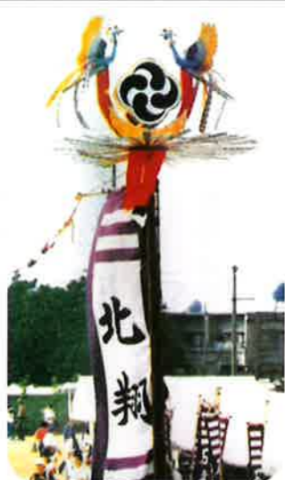
石嶺町旗頭保存会