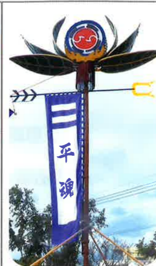
平良町自治会(子ども会)