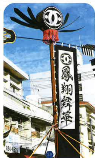
鳥堀市街地住宅自治会