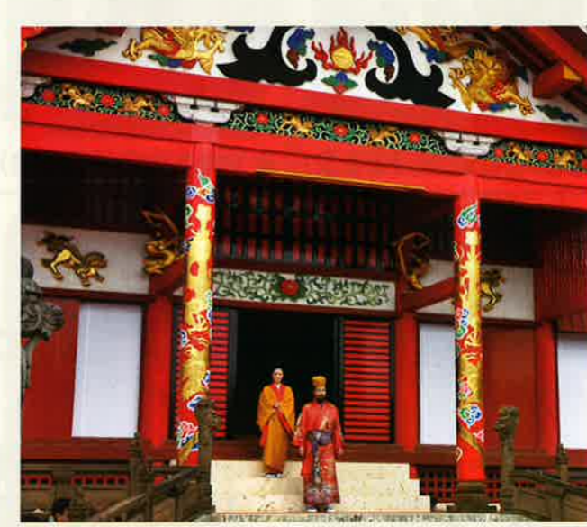
※往時、古式行列へは王妃の参加はございませんでしたが、再現儀式に華やかさを加えるため、演出上、出演させております。

琉球王朝祭り古式行列について 琉球王朝祭り古式行列は琉球国王の行幸の一つである。正月三日「初行幸」とよばれる三ヶ寺参詣行幸の行列を再現したものである。 三箇寺初行幸は俗に「ハチウチヨウハイ」と云う。 円覚寺、天王寺、天界寺、有行幸而為先王御拜也