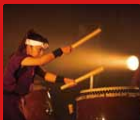
花火大会 第2部演出 残波大獅子太鼓