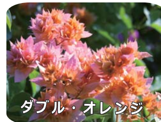
ダブル・オレンジ