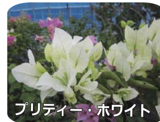
プリティー・ホワイト