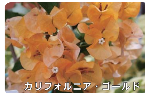
カリフォルニア・ゴールド