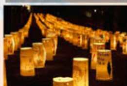
※「万国津梁の灯火」のようす