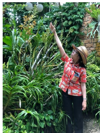
【ヒトの背丈を優に超える花茎】