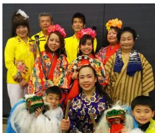
琉球芸能団ゆらていくあしび