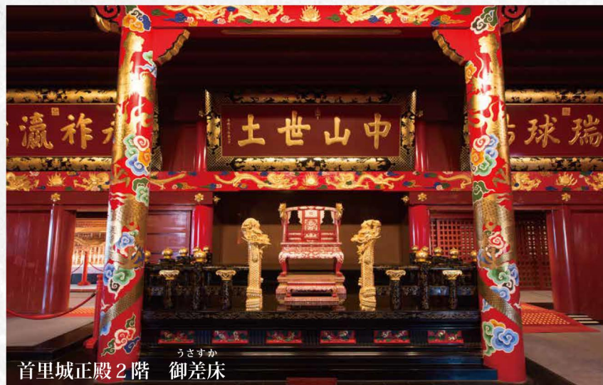
首里城正殿2階 御差床

動物に出会えるのは、展示室の中だけではありません。 正殿の中や園内にも動物たちがいます。 正殿の入り口や屋根、御差床の柱や梁には 龍の姿を見ることができます。 正殿だけでも実に33体もの龍が存在しているのです。 また園内では、石で造られた獅子が 門の側に鎮座しています。 災いを退け、首里城と訪れる人びとの安全を 守っているのではないのでしょうか。