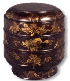
黒漆葡萄栗鼠箔絵食籠