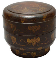
「黒漆葡萄栗鼠沈金食籠」