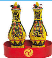
南殿二階特別展示室