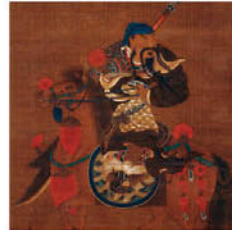
黄金御殿特別展示室