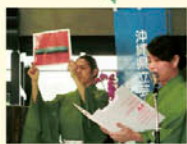
最後にはみんなでカチャーシー