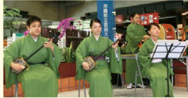
琉球楽器の解説も

毎月第1火曜日に沖縄県立芸術大学の学生によるコンサートが首里城で開催中。今回は6/2の琉球古典音楽と民謡を演奏する様子をご紹介します。