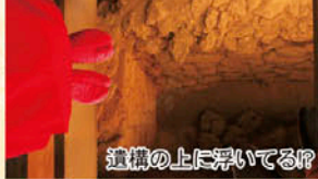
遺構の上に浮いている?