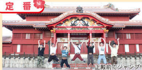
正殿前でジャンプ!!