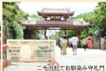
二千円札でお馴染み守礼門