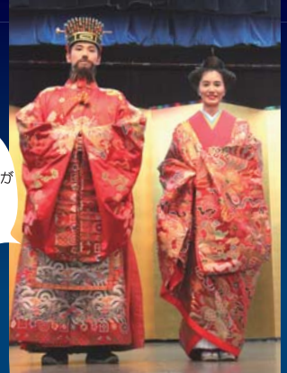
◀昨年度の国王・王妃(両端)のお二人と記念撮影ありがとうございました。