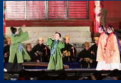
琉球舞踊「靄童」 (しゅんどう)