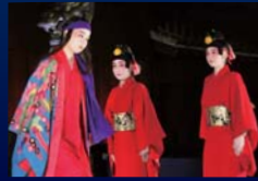
組踊「女物狂」 (うんなおめくら)