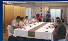
▲厳正なる審査の様子