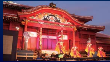
琉球舞踊「四つ竹」 (よつたけ)

9/27日の「中秋の宴」が台風の影響で中止となったため、都ホテルに場所を移動し開催しました。