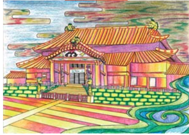
「首里城・正殿」新垣 礼智