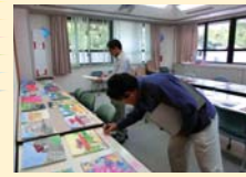
厳正なる審査の様子

9/1(火)から11/30(日)まで応募を受付けておりました、 図画・フォト作品の受賞作品が決定しました!