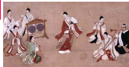
▲琉球人舞樂之図(りゅうきゅうじんぶがくのず)

平成13年から18年にかけて、尾張徳川家伝来の琉球楽器セットを模造復元しました！