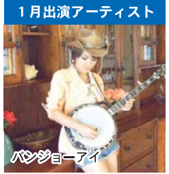
1月出演アーティスト