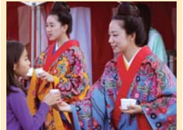
▲さんびん茶とノンアルコールの甘酒に終日大盛況