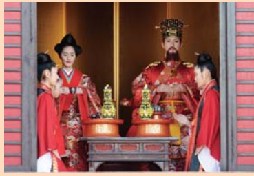
▲第三部「大通り」お祝いの酒を召し上げる国王と王妃