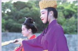
▲沖縄県立芸大「かぎやで風」