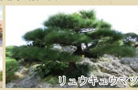
ウヰウキウヰマツ