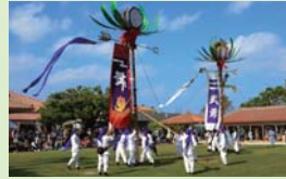
▲首里赤田町・鳥堀町青年会