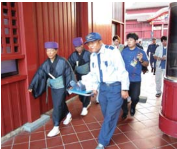
▲地震・津波訓練での負傷者救出状況

首里城公園では毎年職員を対象に地震津波訓練と火災訓練を行っています。去る11・12月、那覇中央消防隊の協力のもと災害発生時における初期動作やお客さまの救護救出、避難誘導等の手順を確認しました。負傷者が発生したシミュレーションや消火器及び屋外消火栓の取扱いなどを訓練し、職員の防災意識を高めています。