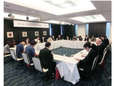
▲城郭管理特有の共通課題について意見交換