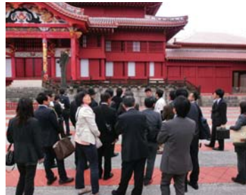
▲首里城正殿前での現地視察の様子

第50回全国城郭管理者協議会を去る11月、沖縄で開催しました。姫路城や名古屋城など城郭管理者の会員22城郭・35名が那覇市内での研修会に参加し、玉陵～首里城公園～首里城公園未開園区域を現地視察しました。城郭管理に携わる職員ならではの視点で、各会員が事例紹介や質疑などを活発に行い、有意義な研修及び交流となりました。