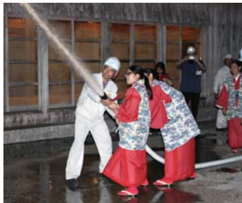
▲放水銃を実際に使用し、消火手順を学ぶ職員