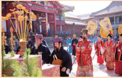
▲王国時代の正月儀式を再現。平和を祈念しました