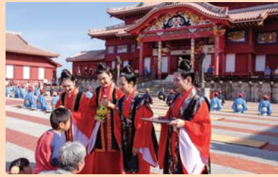
▲若衆が甘酒を振る舞いました