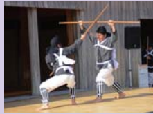
▲八重瀬町字東風平の棒術