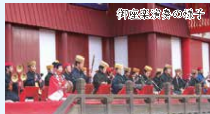
御座楽演奏の様子

王府や御殿での祭事などに酒器として用いられた道具。正月儀式では国王や臣下にお酒を賜うときの道具として使われます。