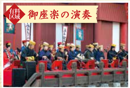
有料区域 御座楽の演奏

御座楽の演奏とともに、国王・王妃が正殿から出御します 1月3日(火) ①10:00～ ②11:00～(各回20分程度) 場所／御庭