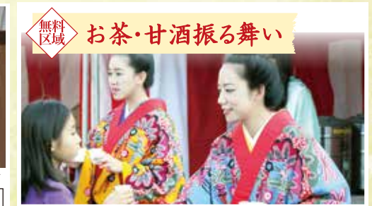
無料区域 お茶・甘酒振る舞い

首里城で育まれた琉球舞踊や地域の民族芸能を披露します 1月1日(日)～3日(火) ①12:30～ ②13:30～ ③14:30～ ④15:30～ ⑤16:30～(各回30分程度) 場所／下之御庭 系図座・用物座 特設ステージ