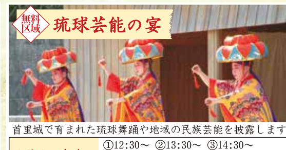
無料区域 琉球芸能の宴

首里城で育まれた琉球舞踊や地域の民族芸能を披露します 1月1日(日)～3日(火) ①12:30～ ②13:30～ ③14:30～ ④15:30～ ⑤16:30～(各回30分程度) 場所／下之御庭 系図座・用物座 特設ステージ