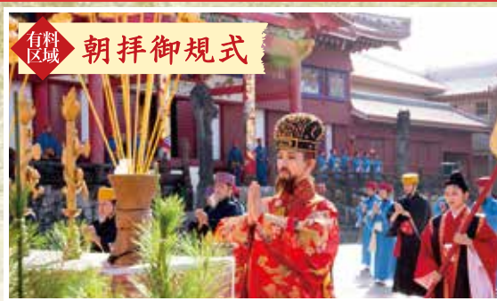
有料区域 朝拝御規式