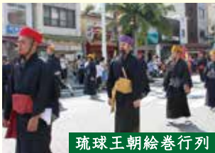
琉球王朝絵巻行列