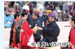
振る舞い酒の様子