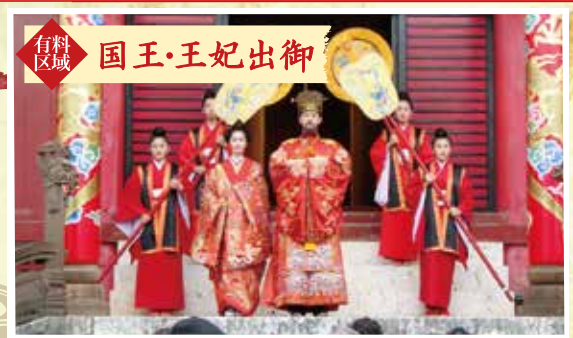
有料区域 国王・王妃出御

王国時代、元旦に執り行われていた儀式を再現します 1月1日(日)・2日(月) 10:00～11:50 (3部構成) 場所／御庭