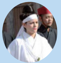
▲世界のウチナーン チュも参加!