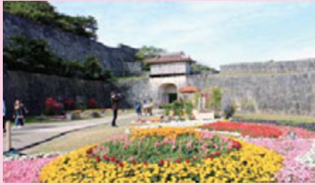
▲瑞泉門下に広がる花々

1月13日～2月26日の期間開催しました。 假屋崎省吾氏によるいけばなのデモン ストレーションや、園内草花装飾では多く のお客さまに楽しんでいただきました。