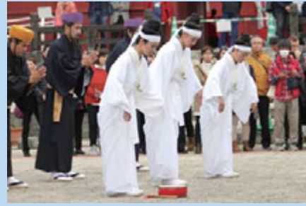
▲腕をだらりと下げ、鳥の羽のようにパタパタと手を動かします♪

1月21日(土)・22日の期間開催しました。 新春の宴など華やかな儀式とは違い、厳かな雰囲気の中、 神秘的な女性の祈りの世界をご体感いただきました。