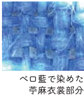
ペロ藍で染めた 苧麻衣裳部分