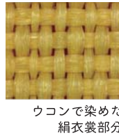
ウコンで染めた 絹衣裳部分