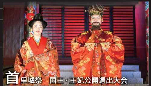
首里城祭 国王・王妃公開選出大会

ご注意 現在、正殿漆塗り直し作業をおこなっており、イベント当日も作業足場やシートが組まれております。ご来園の皆様方には、大変ご迷惑をおかけしますが、ご理解・ご協力いただきますようお願い申し上げます。塗り直し作業に関する情報や詳しいイベント情報は首里城公園HPでご確認ください。