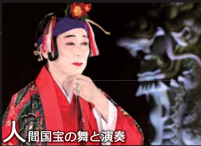
人間国宝の舞と演奏

月明かりに照らされた正殿を背に、人間国宝による最高峰の古典舞踊や組踊が披露されます。首里城と琉球芸能が織りなす最高の舞台。贅沢なひとときをお楽しみください。