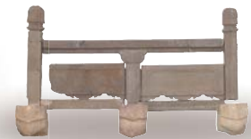
欄干(首里城跡正殿地区)