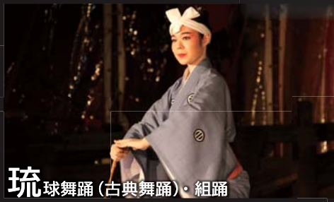
琉球舞踊(古典舞踊)・組踊