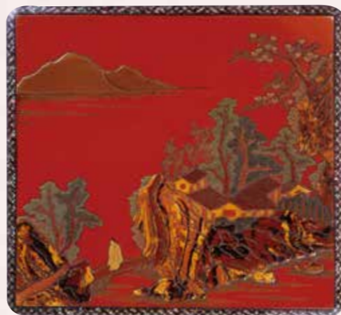
しゅうるしんずいろうかくじんぶつついぎんらでんよんだんじゅうぼこ 朱漆山水楼閣人物堆金螺鈿四段重箱(蓋)

19世紀中頃の屏風に描かれた『那覇港図』には、ハーリー見物している琉球の人々が、船の上で重箱のようなものを囲んでいる様子が描かれています。三段や四段に重ねられた箱の中に、ぎゅぎゅつと詰められたご馳走。当時の人々がどのようなものを好んで詰めていたかは詳しく分かっていませんが、士族階級の人たちにとって楽しいイベントのひとつだったに違いありません。また、絵画から現存する重箱に眼を移してみましょう。黒漆や朱漆の塗りが施され、螺鈿(らでん)や沈金(ちんきん)、箔絵(はくえ)、堆錦(ついぎん)などの技法を使って装飾されていることがわかります。唐草文様や山水楼閣など中国的なデザインもあり、当時の人々のこだわりを感じることができるでしょう。