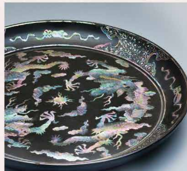
くろうるしうんりゅうらでんおおぼん 黒漆雲龍螺鈿大盆

琉球王国の中心であった首里城は、政治や儀式を執り行う大切な場所であると同時に、王族の住居としての役割も果たしていました。様々な顔を持つ首里城には、王家が使用したと伝わる、希少価値の高い宝物が多く收藏されています。高温多湿な琉球では、気候的にマッチしていたことから漆器を作る技術が発達しました。その中でも、首里城が所蔵する『黒漆雲龍螺鈿大盆』は直径約85cmもの大きさを誇る立派な大盆です。黒漆のお盆は多くあれども、ここまでのサイズは世界に6つしかないと言われていています。夜光貝を薄く削り嵌め込む螺鈿技法で描かれた龍は、5本の爪を持っていることから中国皇帝への贈り物であったことがうかがえます。光の当たる角度によって様々な輝きを見せる様子は、見る者を虜にします。企画展「王家の秘宝」では、この他にも、王国時代の優れた技法が施された秘蔵の美術工芸品を多数ご紹介いたします。ぜひ足をお運びください。