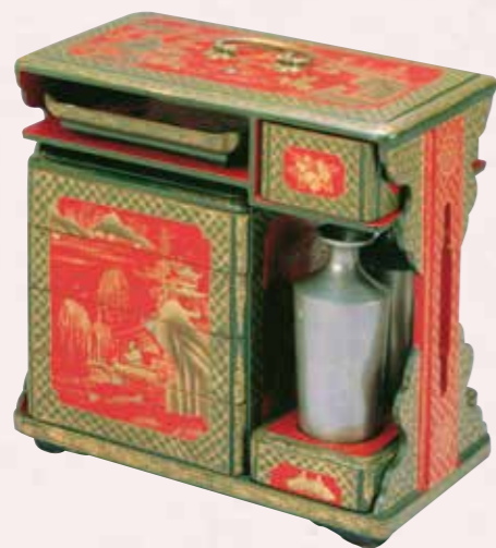
しゅうりくろくしんずいろうかくじんぶつはくえさげじゅう 朱緑漆山水楼閣人物箔絵提重

琉球の人々は、野外で食を楽しむために「提重」という携帯用の重箱セットも使用していました。箱型の枠の中に、何段かの重箱や酒瓶、お皿やお盆がセットとなっており、持ち運びに便利ように取手が付けられているのが特徴です。さらに、重箱と一緒に「湯庫」と呼ばれる容器に茶湯を入れて持ち歩くこともありました。木製の桶のような容器の中に錫(すず)の瓶が入っており、今でいう魔法瓶や水筒にあたります。