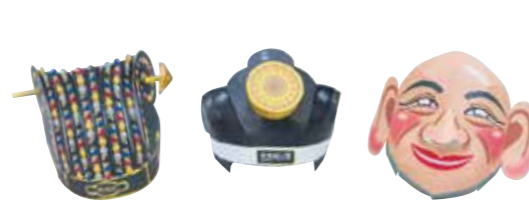
ハサミを使わずカンタン!

実施日 期間中 毎日 時間 10時00分~16時00分 場所 首里杜館1階情報展示室 料金 無料