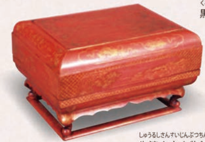
しゅうるしさんすいろくからでんざげじゅう 朱漆山水人物沈金東道盆