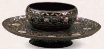
くろうるしきくからくからでんぞんもくだい 黒漆菊唐草螺鈿天目台