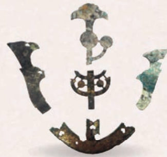
かぶと まえた 首里城出土の兜の前立て