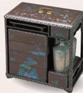
くろうるしさんすいろくからでんざげじゅう 黒漆山水楼閣螺鈿提重