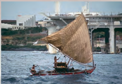
The Chechemeni arriving at the venue of the Okinawa International Ocean Exposition in 1975 after an epic 3,000-kilometer voyage from Micronesia using only traditional navigation arts. The boat is on display at the National Museum of Ethnology in Osaka.

Professor emeritus University of Ryukyus, research advisor at Okinawa Churashima Foundation and in charge of exhibitions on Okinawa for the 2013 Oceanic Culture Museum exhibition renewal