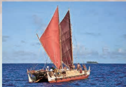
In 2007, Hawaii's Hōkūle'a made a voyage of thanks to show their Aloha, which means love, appreciation, etc., to a master navigator from Micronesia for teaching them traditional navigation arts and to the Japanese who immigrated to Hawaii in the Meiji period (1868-1912).