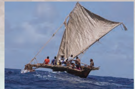
To coincide with the renewal of the Oceanic Culture Museum, a canoe was crafted using traditional materials and methods on Micronesia's Polowat Island. Christened the Lien Polowat , the ship traveled more than 800 kilometers to Guam using only traditional navigation arts.