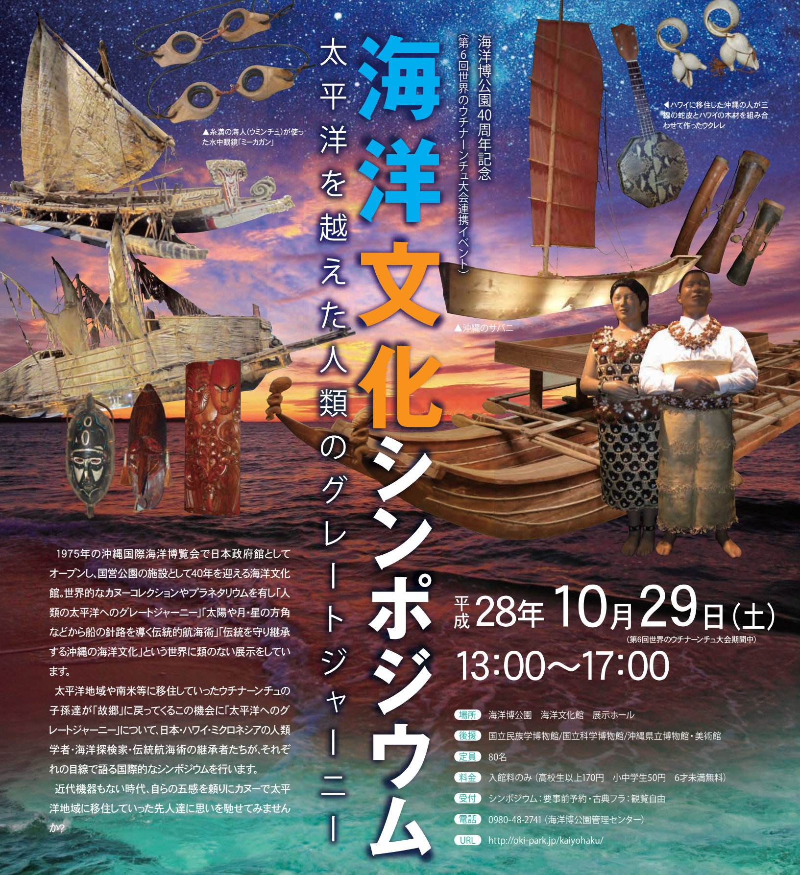
▲糸満の海人(ウミンチュ)が使った水中眼鏡「ミークガン」