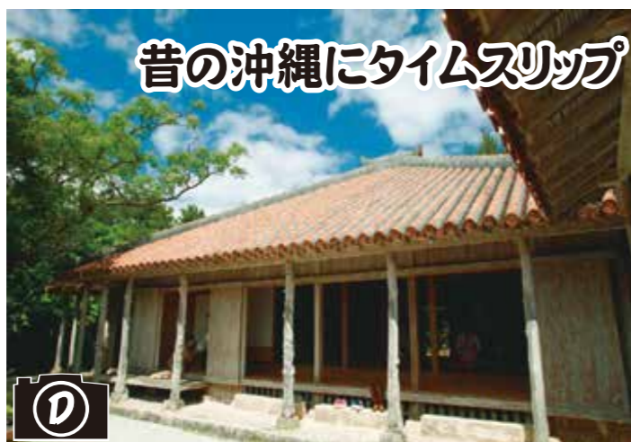
昔の沖縄にタイムスリップ