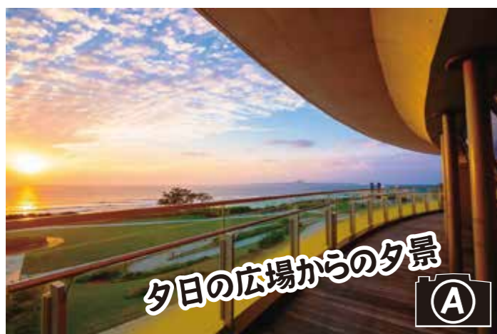
夕日の広場からの夕景

景色や花々、生き物たち、歴史ある建物など、公園内にあるフオトスポットからオススメを紹介します!!