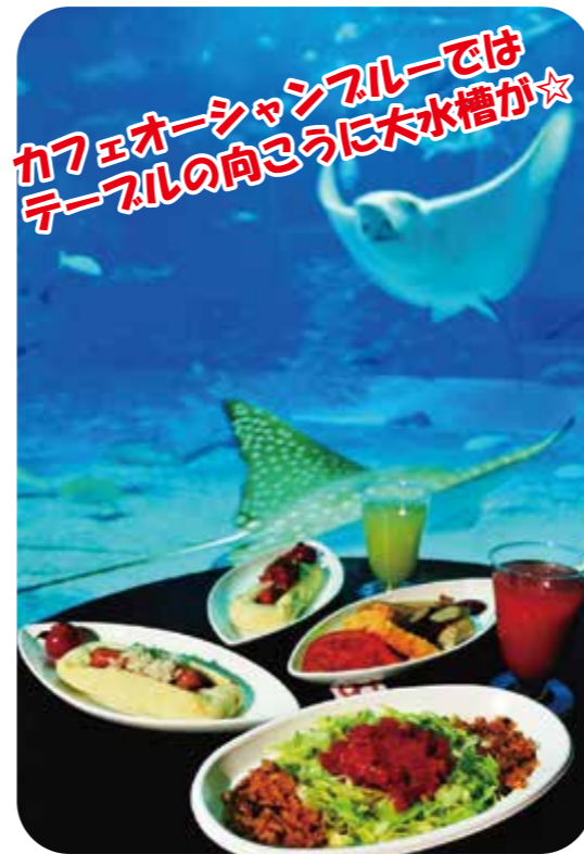
▲【カフェオーシャンブルー】⑱

公園内では沖縄そばやタコライス等の沖縄の定番メニューから、オリジナルスイーツまで、お客様のニーズに合わせた軽食やお食事が楽しめます。