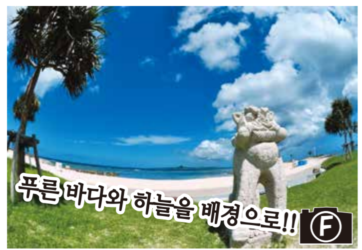
푸른 바다와 하늘을 배경으로!!