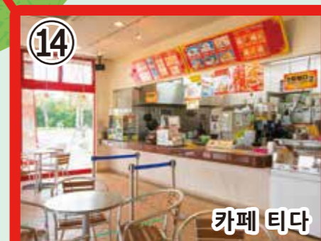
14 카페 티다