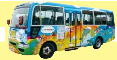
리프트가 있는 유람차

고래상어, 흰동가리 등 귀여운 디자인이 매력적입니다. 여러 종류의 디자인 유람차 타보시지 않으실래요?