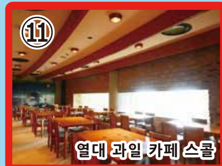
11 열대 과일 카페 스쿨