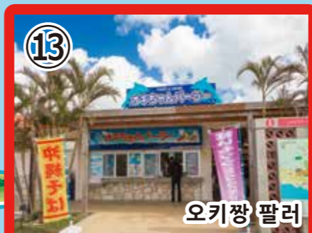
13 오키짱 팔러