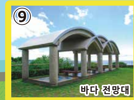
9 바다 전망대