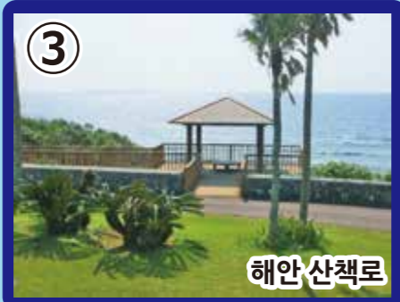
3 해안 산책로