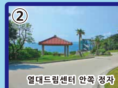
2 열대드림센터 안쪽 정자