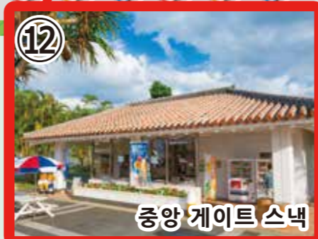
12 중앙 게이트 스낵