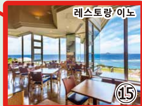
15 레스토랑 이노