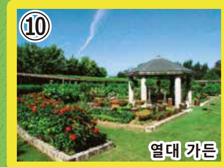
10 열대 가든