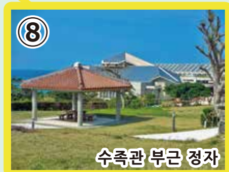
8 수족관 부근 정자