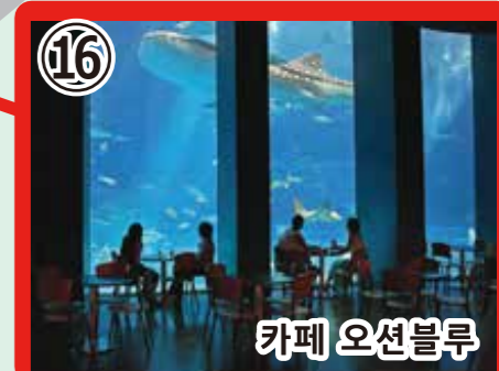
16 카페 오션블루