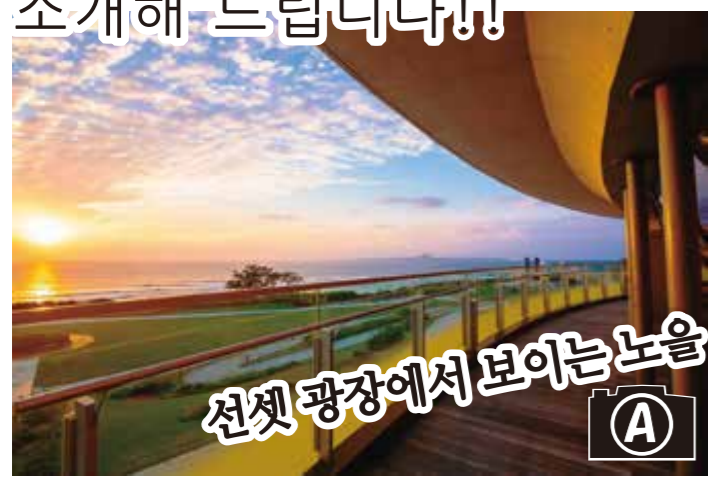
선셋 광장에서 보이는 노을