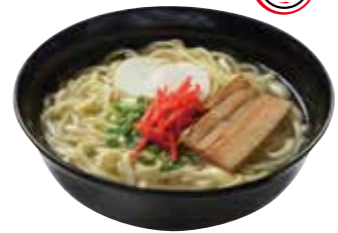
▲【카페 오션블루】 ⑯