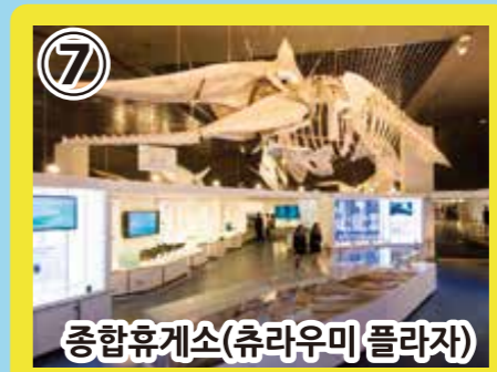
7 종합휴게소(츄라우미 플라자)