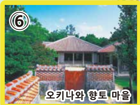
6 오키나와 향토 마을