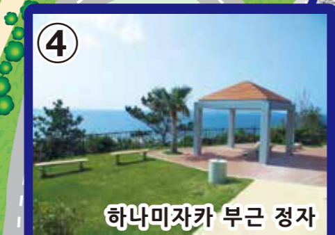
4 하나미자카 부근 정자