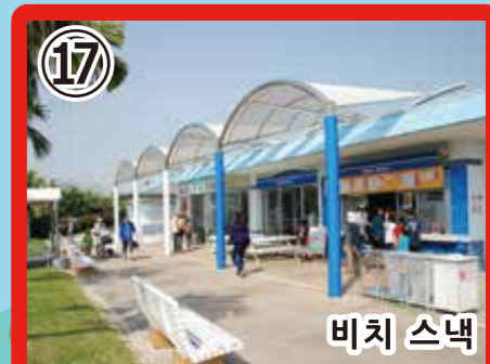
17 비치 스낵