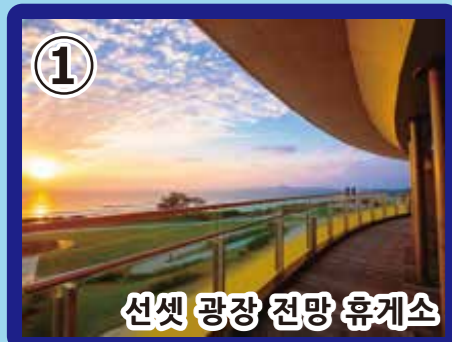
1 선셋 광장 전망 휴게소