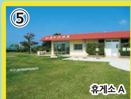
5 휴게소 A