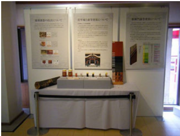
설명 전시 이미지

옷 도장 개수 등 작업에 관한 설명 전시(각 공정의 해설판 패널과 공정 옷칠판, 원재료 등)를 실시합니다.