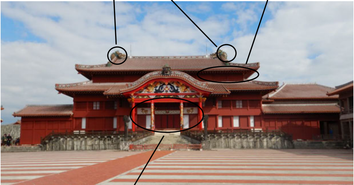
【외벽부 옷칠 박리】