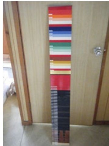
옷칠판에 의한 채색 도장