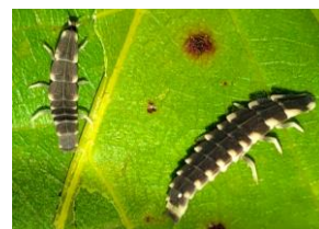
オキナワマドボタルの幼虫