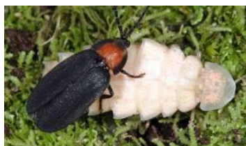
オキナワマドボタル

沖縄には、どんなホタルがいるのかな？ 暗室で、光るホタルの幼虫や成虫を観察してみよう！