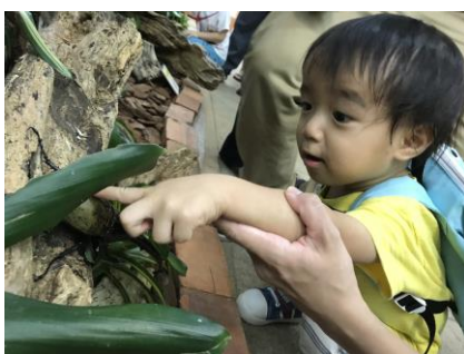
昆虫に触れてみよう！