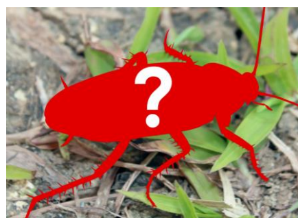
ゴキブリの部屋が登場！！