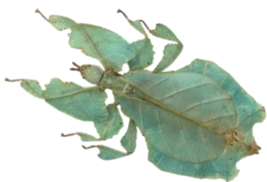
葉っぱに見える？！コノハムシ

海洋博公園 熱帯ドリームセンターは、見て、触れて、学べる昆虫展「沖縄と世界の貴重な昆虫展～植物になりきる昆虫たち～」第 1 弾（ヤンバルテナガコガネのタイプ標本展示）を開催し、多くの方々にご参加いただきました。9 月 7 日（土）からは、第 2 弾「夜に輝く虫たち」をホタルを中心とした展示でご紹介します。第 1 弾でも好評だった、今季初登場のゴキブリの部屋では、阿鼻叫喚…！パワーアップした昆虫展をお楽しみください。