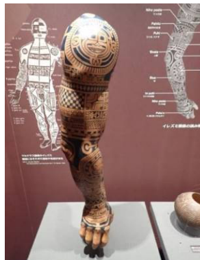
マルケサス諸島のタトゥー模型 （海洋文化館の展示品）