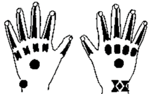
沖縄の入墨・ハジチ(市川重治「針突の文様」 『青い海』1984年4月号より)