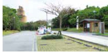
P8 ドリームセンター前駐車場