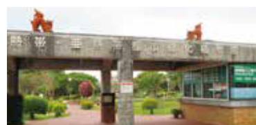
植物園入口案内所