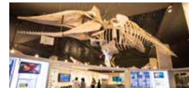
総合休憩所(美ら海プラザ)

園内各所への移動にお困りの際は、パトロールカーによる送迎が可能です。 (ご利用可能時間9:00~17:00) 海洋博公園管理センター(0980-48-2741)へご連絡ください。 (お時間を頂く場合がございます。予めご了承下さい。)