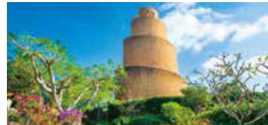
熱帯ドリームセンター ※詳細は裏面参照