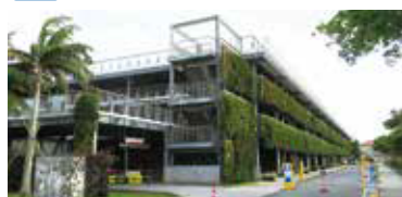
P7 北ゲート駐車場(立体)