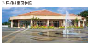
総合案内所(ハイサイプラザ) ※詳細は裏面参照