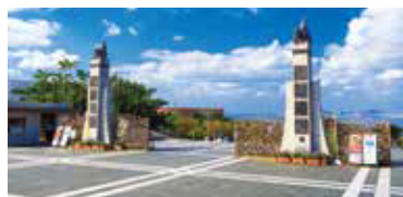
中央ゲート周辺 ※詳細は裏面参照