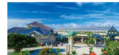
沖縄美ら海水族館 ※詳細は裏面参照