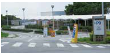
P9 エメラルドゲート駐車場(立体)