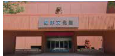
海洋文化館 ※詳細は裏面参照