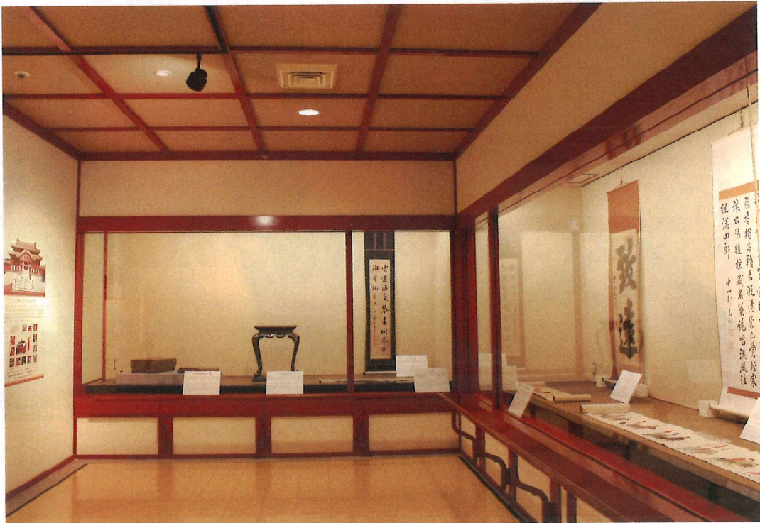
〔江戸時代の琉球Ⅰ ～江戸上り 琉球人使節がやってきた!～〕 展示風景