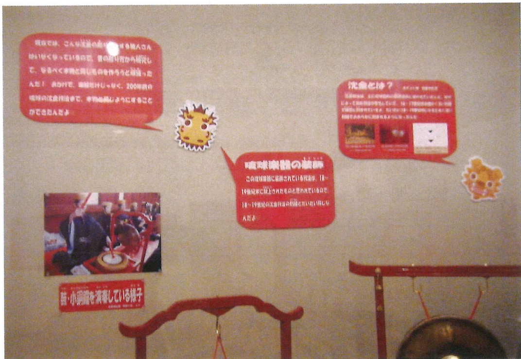
〔キャラクターと吹き出しを使用したワンポイント解説〕