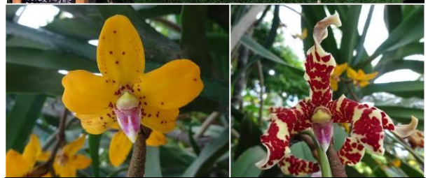
株元に近い方の花