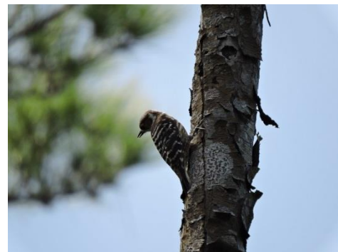
リュウキュウコゲラ（海洋博公園内）