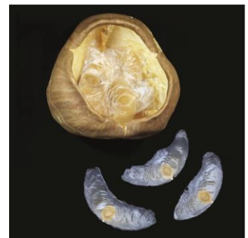
ヒョウタンカズラの果実と種子

<お問い合わせ先> イベントの詳細・取材などにつきましては、下記にお問い合わせ下さい。