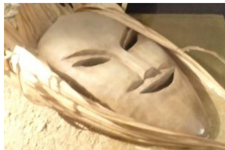
宮古島の仮面神・パーントゥ