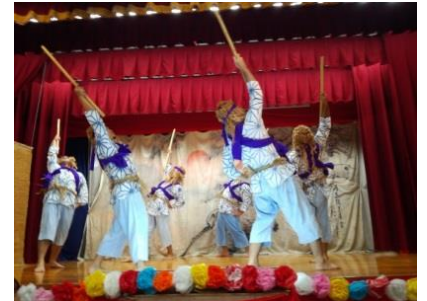
名護市嘉陽のフェーヌシマ