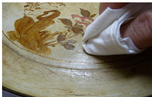
図5 桐油を綿布で擦り込む