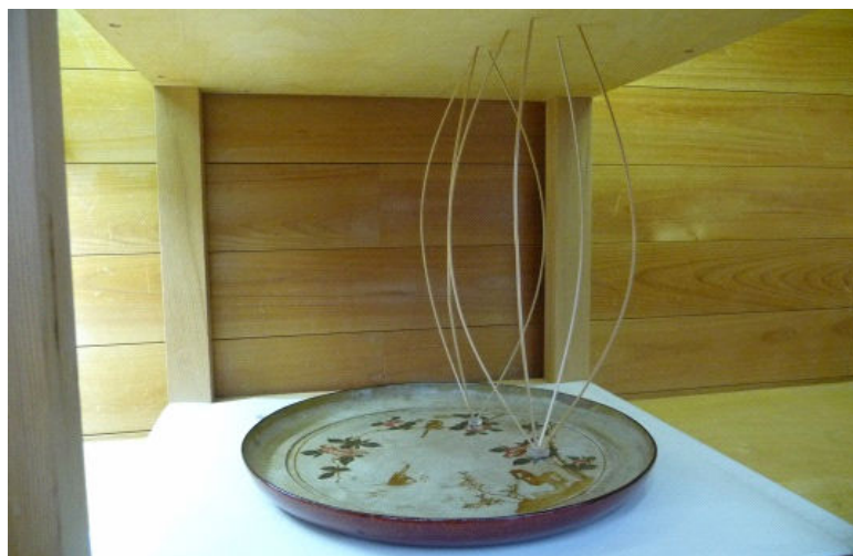
図3 心張り法により剥離・剥落塗膜を押さえる

剥離、剥落塗膜の接着には膠を用い、木枠と竹ひごの弾力を利用した心張り法により圧着安定させた(図3)。