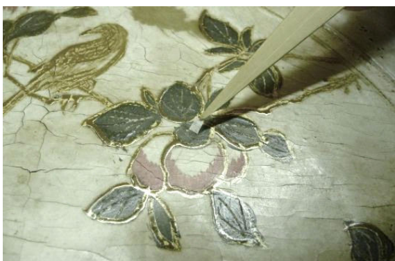
図1 剥離塗膜を養生する

漆塗膜部の汚れで一部取りきれないものは、水とエタノールを混合した溶液を使用した。