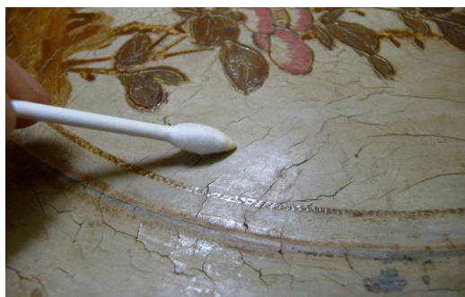
図4 綿棒で桐油を塗布する

劣化した白密陀(地塗り)部分の塗膜強化と艶を回復するために、ボイルし乾燥促進のための一酸化鉛を添加した桐油を、綿棒と柔らかい綿布で極薄く塗膜表面に擦り込んだ(図4、5)。