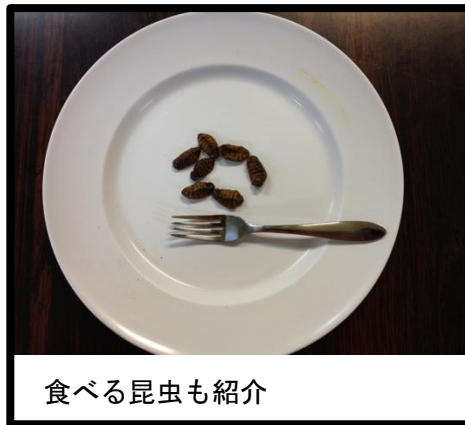
食べる昆虫も紹介