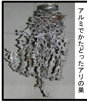
アルミでかたどったアリの巣