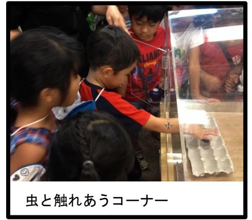
虫と触れあうコーナー