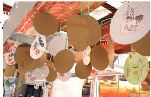
※画像は過去に実施したキッズアートです