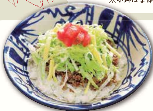
タコライス (ハーフサイズ)

タコライス (ハーフサイズ) + そば (小) Taco Rice (half size) + Soba (small size) セットのそばをお選びください