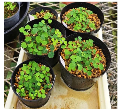
上：自生地での開花状況