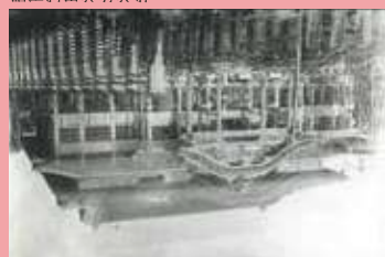
战前的首里城正殿

据传首里城建于14世纪左右，是一座融合了中日文化的琉球独特城郭，曾是琉球王国最大的木造建筑。首里城是国王及其家族居住的“王宫”，同时也是王国统治的行政机构“首里王府”的总部。此外，这里也是被派至各地神女们执行王国祭祀的宗教据点。1879年成为冲绳县之后，首里城被作为日本军队的驻扎地和各种学校等使用。后于1945年的冲绳战役中被烧毁，战后成为琉球大学的校区。大学搬迁后启动了复原项目，并于1992年以首里城公园对公众开放。被复原的首里城参考的是18世纪以后的首里城蓝图。