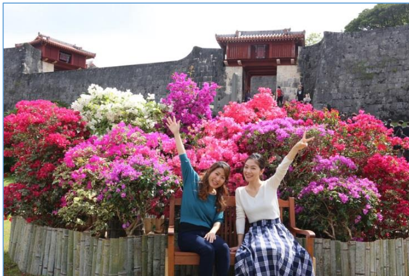
▲瑞泉門をバックに記念撮影ができます