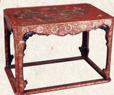
しゅうるしかちょうらでんじよく 朱漆花鳥螺鈿卓