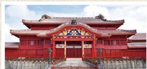
平成28年8月から着手していた首里城正殿外部の漆等塗り直しの作業が、平成30年11月に完了しました。