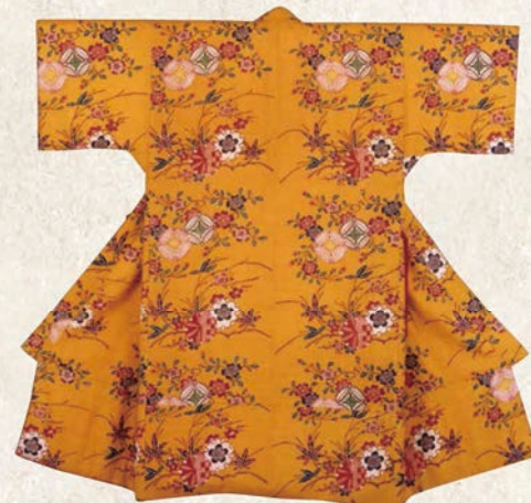
きぬき いるじうめざくらがえでゆきわて まりもんようびんがたあせいしよ 絹黄色地梅桜楓雪輪手毬文様紅型袷衣裳