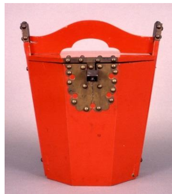
朱を使った琉球漆器 鮮やかな「赤」が特徴です。

琉球は周辺諸国との交易を通じて様々な文化を吸収して様々な工芸技術を磨いてきました。その美の結晶が国内で唯一赤い彩色で塗られた首里城正殿です。今回の企画展では、その首里城の赤を考えるため、琉球の工芸品を朱、弁柄、臙脂などの「赤」の色材(絵具)ごとに紹介します。工芸品だけでなく、めったに見られない首里城を塗った赤い原料や工芸品の原材料も展示紹介します。この機会に、色彩や明度のバリエーションが豊かな琉球の「赤」の世界をお楽しみ下さい。