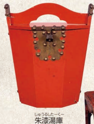
しゅうるしたーく 朱漆湯桶