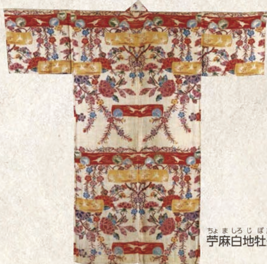
ちよましろじぼたんしだれざくらりょうめんびんがたひとえいしよ 苧麻白地牡丹枝垂桜両面紅型単衣裳