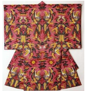
臙脂を使った紅型 臙脂はカイガラムシという 昆虫が原材料です。美しい桃色が特徴です。

<お問い合わせ>(一財)沖縄美ら島財団 首里城公園管理部 首里城事業課 業務広報企画係・調査展示係