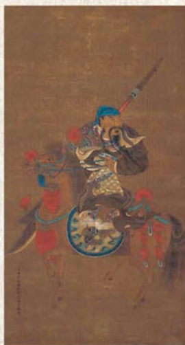
かんろうぞうごしけん 関羽像(呉師虔筆)