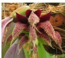
ファレノプシスの花