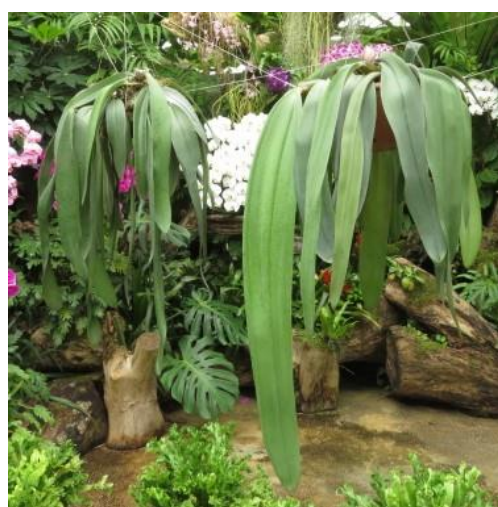
展示状況（左：ファレノプシス、右：スピーシー）

インドネシアのニューギニア島原産の大型の着生ランで、直径5-10cmのバルブに長さ100cm以上になる葉を1枚つけます。花はバルブの基部に多数集まってつき、紫色の苞に包まれていて、先がとがった形をしています。萼の外側に粗い毛があり、本種の特徴となっています。開花すると強い腐臭を放ち、ハエなどをおびき寄せ、受粉を手伝ってもらいます。