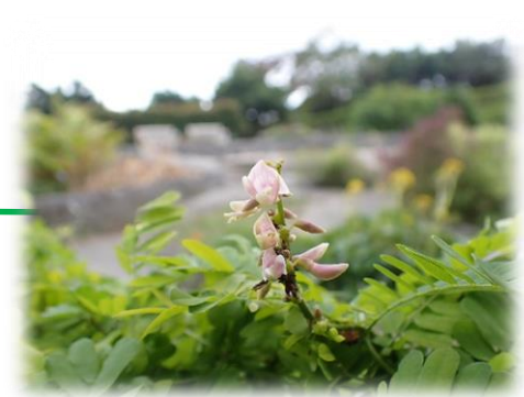
トウアズキ(マメ科)