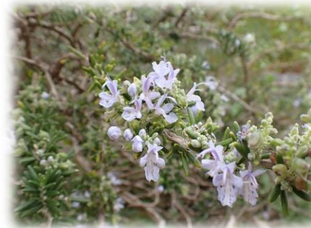
ローズマリー(シソ科)