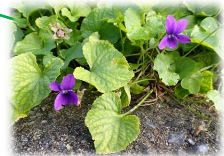
ニオイスマレ(スマレ科)