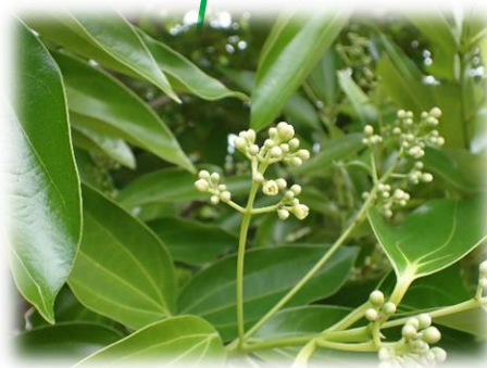
セイロンニッケイ(クスノキ科)