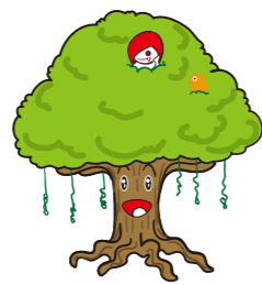
がじゅまるおじさん