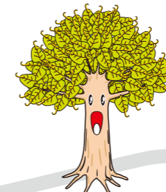
ボダイジュおにいさん