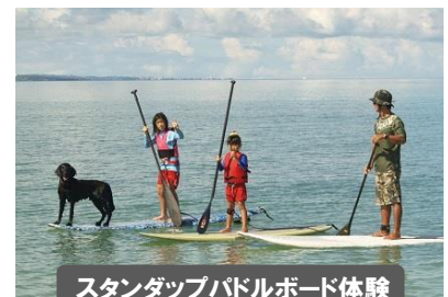
スタンダップパドルボード体験