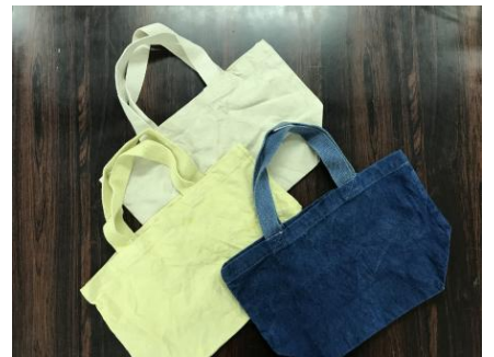
作品例：トートバッグ

※コロナ対策のガイドラインにつきましては、HPに記載しておりますのでご確認ください。