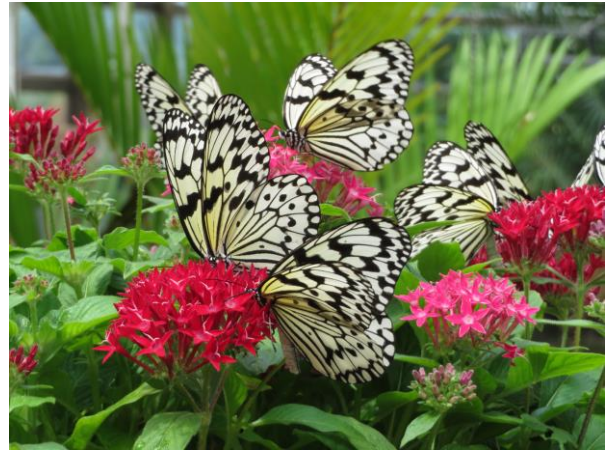
花の蜜を吸うオオゴマダラ