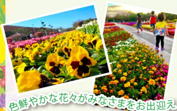
色鮮やかな花々がみなさまをお出迎え