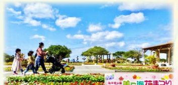
海洋博公園の広い屋外空間を 安心・快適にお楽しみいただけます