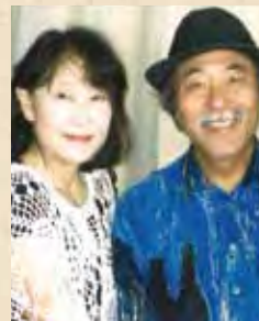
火いろ & 香おる