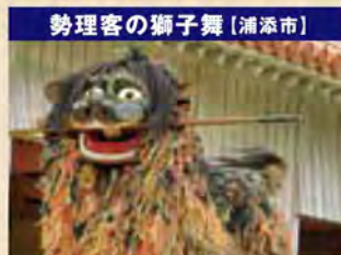
勢理客の獅子舞[浦添市]

屋良のあやぐは昭和51年に嘉手納町の無形民俗文化財に指定されました。あやぐは宮古・八重山に残る古謡の1種で、綾言(あやごと)つまり美しい言葉という意味で、沖縄本島の各市町村にも独特のものがありますが、そのほとんどは男女による群舞です。昔は屋良のあやぐも男女が一緒になって16~18名で踊っていましたが、現在は男性だけで踊っています。踊りを終えて舞台裏に入る際(入羽)に、前後に向きを変えながら肩を組み合せて入っていくところが特徴的です。 宇屋良共栄会