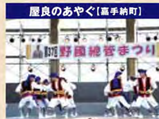
屋良のあやぐ[高手納町]

複数の踊り手が異なった役を演じる舞踊を「打組(うちくみ)」と呼びます。加那ヨ一天川はその代表的な演目。人間の内面を描写して美が表現される古典舞踊とは異なり、水辺で展開される男女の恋の駆け引きを、大胆な手法で踊ります。躍動感溢れ、心わき立つ踊り。 琉球舞踊(雑踊り)