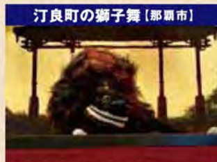
汀良町の獅子舞[那覇市]

宇東風平の棒術は約250年の歴史があるとされており、毎年旧暦の八月十五夜に行われる五穀豊稔を祝う「豊年祭」にて宇東風平の男性によって演武されます。型は西(イリー)と、東(アガリー)それぞれ7~8種類の型があり、オーエティー「喧嘩棒」と言われるような迫力と力強さが特徴です。 宇東風平棒術保存会