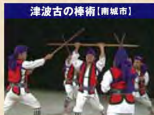
津波古の棒術[南城市]

獅子舞は旧暦八月十五夜の村遊びの行事として古くから伝わる伝統芸能です。中でも浦添の獅子舞は舞の種類が多く、勢理客では11種が伝えられており、国選無形民俗文化財となっています。勢理客の獅子舞は400年以上の歴史を持ち、大きく踏み込む足運びに特徴があり、獅子頭を支える前役の人は、足を90度まで高く上げる豪快な歩き方で、後ろ役はずっと腰を半分折って足踏みをしながら獅子のしっぽを動かしていきます。 浦添市勢理客獅子舞保存会