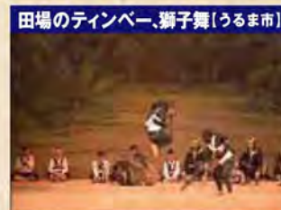
田場のティンペー、獅子舞[うるま市]

沖縄の各地域で歌い継がれている古謡の一つで、女性の歌です。おもろに先行する歌謡形式とされ、1600年代から存在し、何百年も受け継がれてきた女性の祈りといえます。琉球の都だった首里でも王朝文化を象徴する歌謡が口伝で残っており、首里のクェーナは那覇市指定無形民俗文化財に指定されています。 首里クェーナ保存会