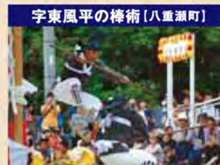
宇東風平の棒術[八重瀬町]

南城市佐敷津波古棒術は約300年の歴史があるとされ、南城市の無形民俗文化財に指定されています。棒の種類には歌三線ののせて祝いや行事の最初に演ずる舞方(メカタ)棒をはじめ、打ち鳴らす銅鑼や鉦に合わせて演ずる一人棒(チュイボウ)、二人棒(タイボウ)、三人棒(ミツチャイボウ)、四人棒(ユッタイボウ)、五人棒(グニンボウ)などの組棒があります。 南城市佐敷津波古棒術保存会