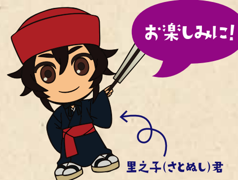
里之子(さとぬし)君

首里城公園のキャラクター「里之子(さとぬし)君」が、着ぐるみとしていよいよデビューです。お披露目式ではノベルティの配布や記念撮影会などを行います。