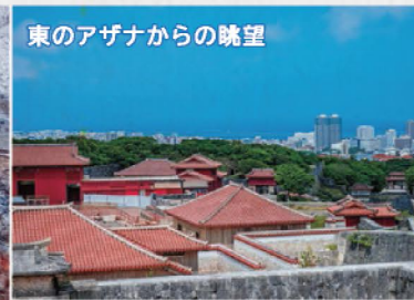
東のアザナからの眺望