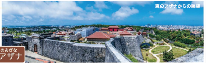
東のアザナからの眺望

※首里杜館と奉神門にて貸出しを行なっています。 お近くの係員へお申し付けください。